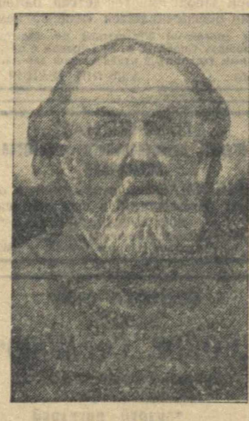
Ученый-изобретатель К. Э. Циолковский.

«Свободное от тяжести пространство» (1883 г.). — так назывался один из первых его научных трудов. Это была еще «школьная работа», как называла ее впоследствии сама Циолковский, и она никогда не была напечатана. Но уже в этом труде, опередив на десятилетия лет ученых других стран, Циолковский указал на реактивный принцип как на наиболее целесообразный способ сооружения летательного аппарата, который дал бы возможность человеку проникнуть в межпланетное пространство. Через три года он закончил обширный научный труд, в котором одновременно давался теория управления аэростата и обоснование идеи создания бескаркасного дирижабля с цельнометаллической оболочкой. Основы этой идеи, достаточно передовые даже и для нынешнего времени и ведущие к созданию сверхвысотного дирижабля, могли воплотиться в то время в России лишь в мечтах. Но счастливой случайности, о работах замечательного самоучки стало известно великому русскому ученому — физику А. Г. Столетову. Он пригласил Циолковского к себе и организовал первое выступление молодого ученого в Политехническом музее в Москве перед ученым миром — на специальном заседании Общества любителей естествознания. Прекрасная научная работа скромного учителя из глухой провинции произвела глубокое впечатление на ученых. Произведения Циолковского стали печататься в научном журнале, издававшемся Обществом. Другое большое научное общество — Русское физико-химическое общество, осно-