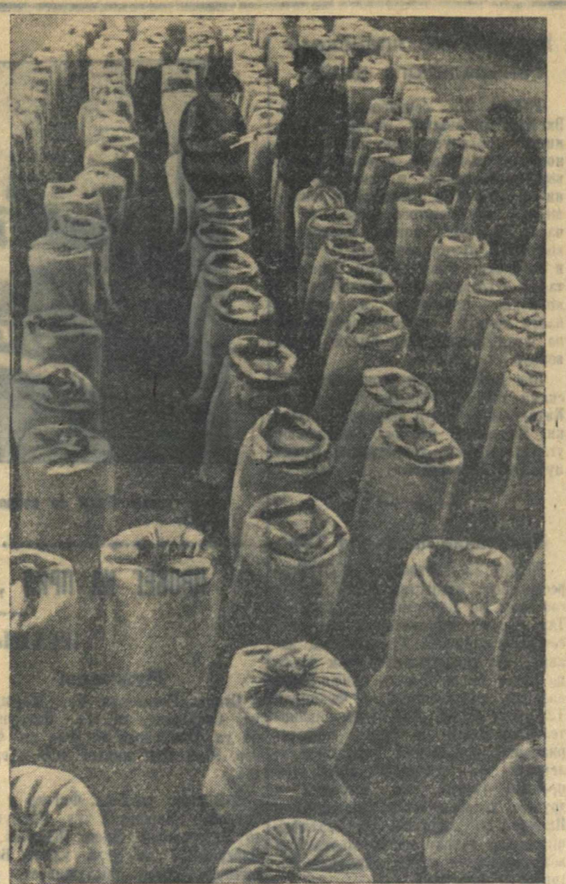
400 центнеров овса сорта «Победа» (супер-элита) подготовил и сдал на склад госхоза имени Ленина колхоз «Советская деревня», Богородского района. На снимке: осмотр мешков с овсом перед отправкой.