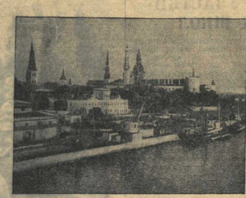
Вид города Риги со стороны Западной Двины (Латвийская ССР).