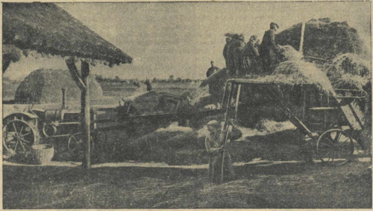
Молотья в колхозе «Рассвет», Гагинского района.