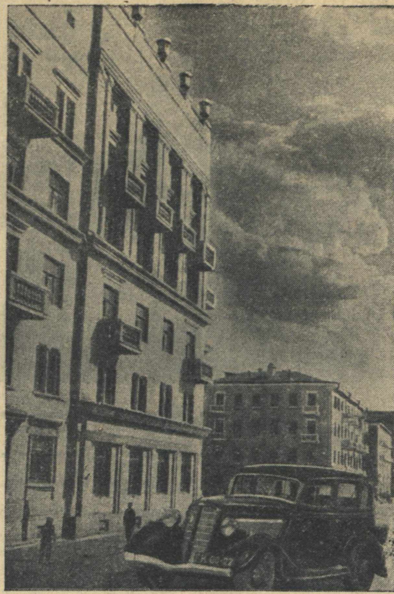
Новый жилой дом в поселке Станкозавода (Ленинский район).

В Южном Китае. На юге провинции Гуанси китайцы атакуют отдельные японские части, продвигаясь к границе Французского Индо-Китая.