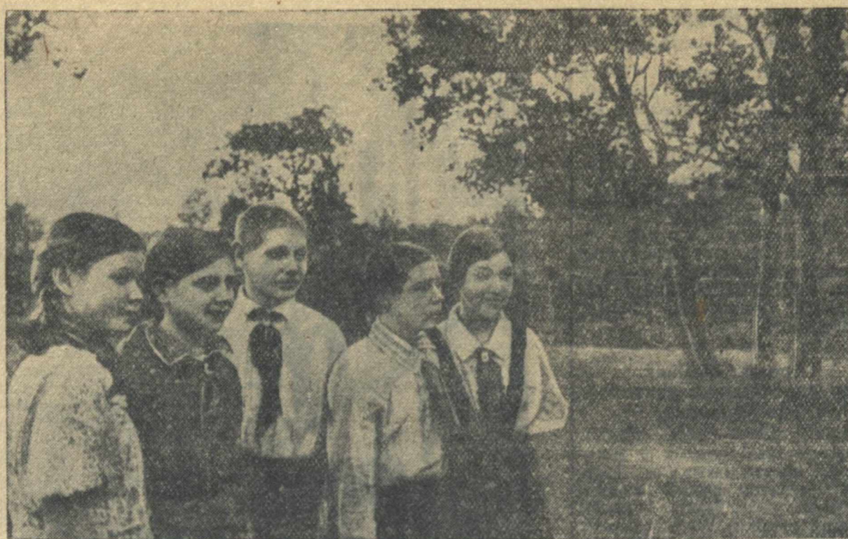
Юные натуралисты, ученики Наменской средней школы Богородского района, — участники Всесоюзной сельскохозяйственной выставки 1940 года. Недавно они вернулись из Москвы, где осматривали сельскохозяйственную выставку.