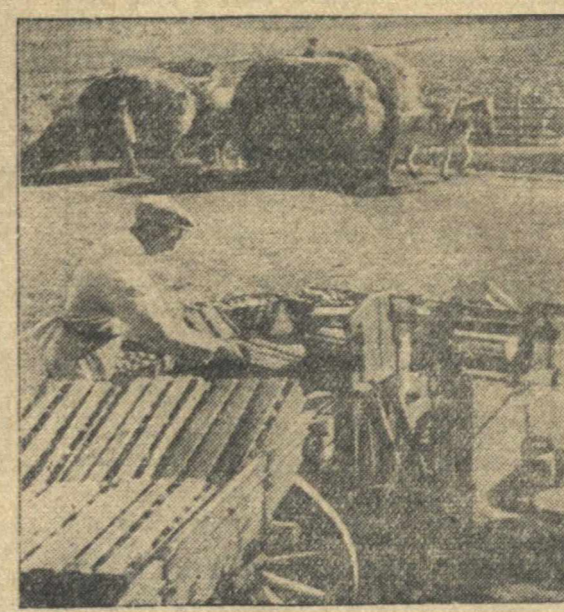
В ординарном колхозе им. Пешнова, Кстовского района. На снимке: приемка помидоров на складе.