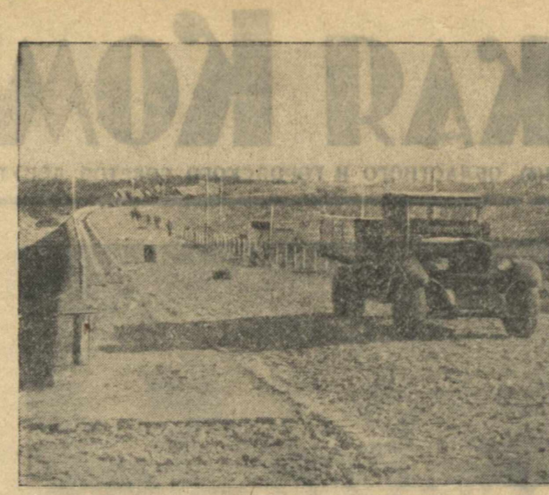
На Истовском участке строительства дороги Горький—Муром—Кулебаки. Шоссе у Теплой горы.

в январе было пропущено брака на 1200 руб., в феврале — на 640 руб., в марте — на 425 руб. и в апреле — на 375 руб. Хороших результатов добились и другие школы. Опыт их работы особенно важен в свете реализации Указа Президиума Верховного Совета СССР о борьбе с выпуском недоброкачественной, некомплектной, нестандартной продукции. Мы убеждены, что в короткий срок через стахановскую школу можно передать опыт работы лучших контролеров и тем самым способствовать выпуску доброкачественной продукции. Вывод ясен: где сеть учебных стахановских школ, там брак резко снижается. В настоящее время решается задача превращения целиком в стахановские отдельных участков и цехов. Первоначальный опыт в этом направлении мы имеем по отделению штампово-инструментального хозяйства арматурного цеха, где в ответ на призыв инструментальщиков Москвы коллектив решил организовать 14 стахановских школ. Школы охватили 63 саесарей, 3 токарей и 4 штамповщиков. Консултантом был назначен ПИИКА г. Еришнина. Школы окончили все работы со следующими оценками: отлично — 15 чел., хорошо — 31, удовлетворительно — 29. Заметно возвысилась культура труда инструментальщиков, улучшилось обслуживание основных производственных линий и участков.