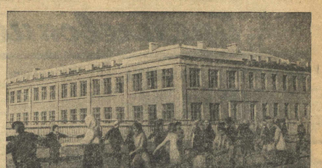
Новая школа в рабочем поселке Шахунья.