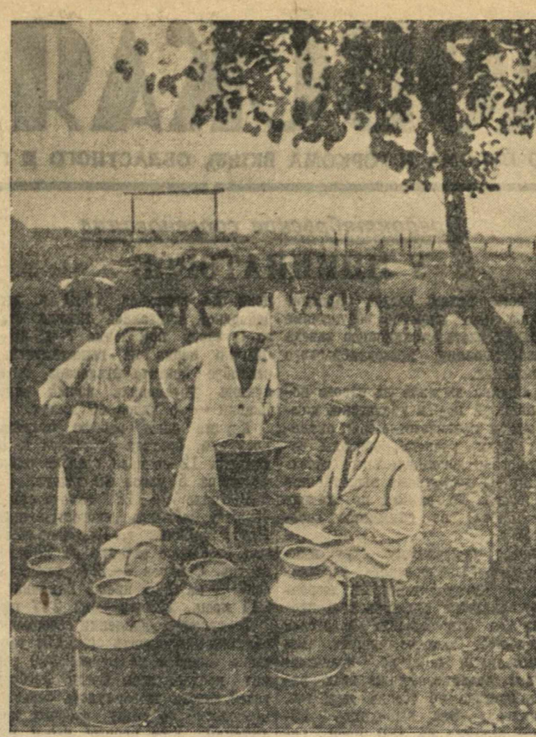
Прием молока на пастбище ордена Ленина колхоза «Советская деревня», Богородского района.

«Горком обсуждал также вопрос об использовании лома черных металлов и обратил внимание хозяйственников на необходимость более широкого использования в шихте мазутной лопы...»