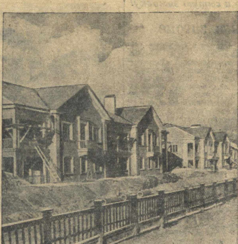
К XIII годовщине Октября заканчивается строительство двенадцатиквартирных домов для рабочих завода «Красное Сормово» на поселке имени Володарского.

Смелый о положении на фронте в Южном Китае лет. 24 октября. (ТАСС).