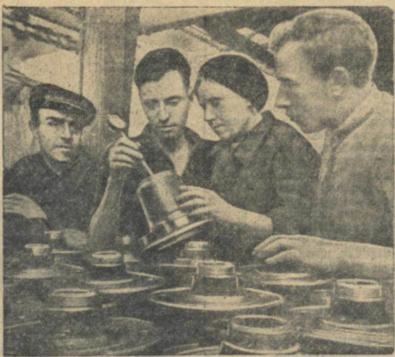
Группа стахановцев-многостаночников цеха шасси Горьковского завода им. Молотова, включившихся в предостережение социалистических соревнований и выполняющих нормы по 200 проц.