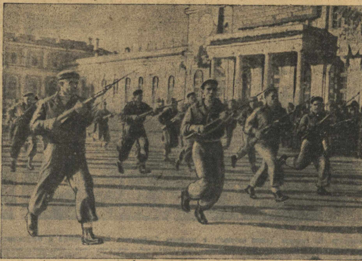
7 ноября 1940 года в гор. Горьком. Выступление слушателей курсов инструкторов физкультуры ВЦСПС на площади им. Челюскинцев.

Гитлер, составивший немногим более пятнадцати летских потерь, потерпевших немцами во франко-русской войне 1870—1871 гг. Гитлер при этом особо отметил, что огромные военные резервы Германии не пришли еще в действие, а материальные запасы настолько значительны, что можно будет прекратить работу некоторых предприятий, так как негде хранить их продукцию, и что он предложил развивать только те отрасли промышленности, в которых Германия должна быть особенно сильна. Германия как в отношении людского состава, так и в отношении материальных средств, заявила Гитлер, как никогда, подготовлена для дальнейшей борьбы. Гитлер также заявил: Германия вместе со своим союзником достигла силы, чтобы противостоять любой возможной в этом мире комбинации. Не существует ни одной великой державы, равной по силе нашей.