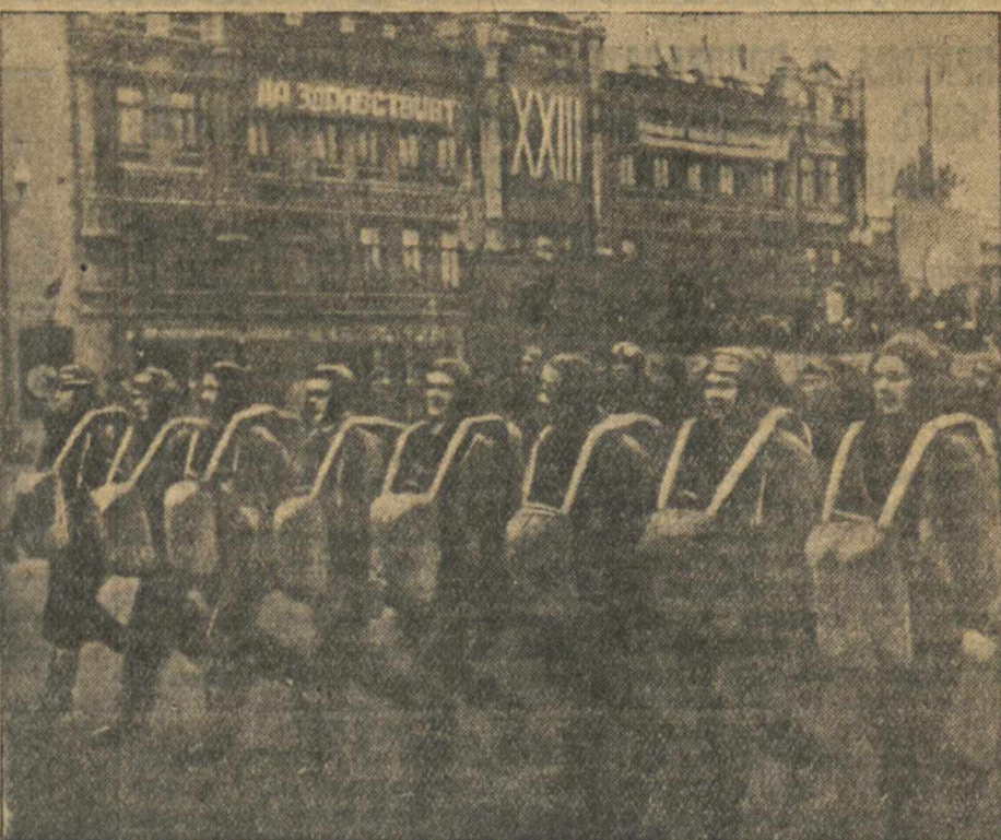
7 ноября 1940 года в гор. Горьком. Демонстранты на площади им. Челюскинцев. На снимках (слева направо): в колоннах Сормовского, Кагановичского и Ворошиловского районов.