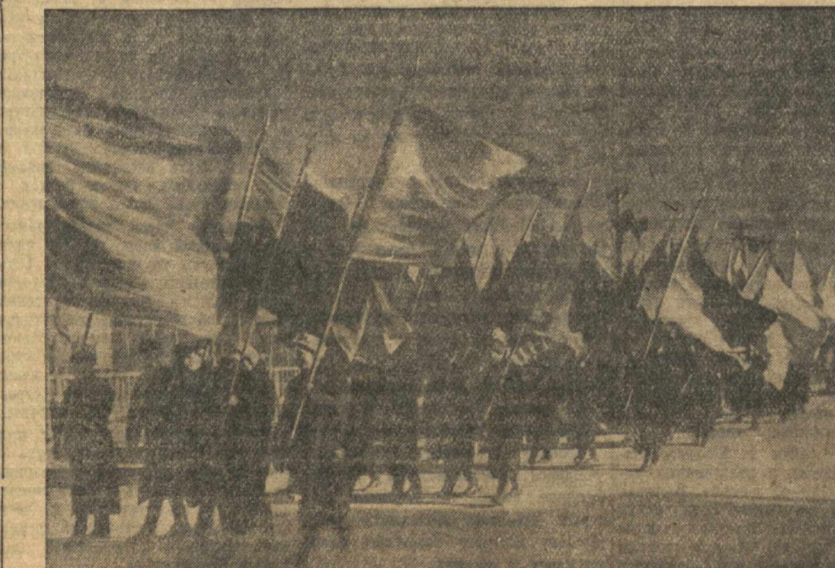
7 ноября 1940 года в гор. Горьком. Демонстрация трудящихся в Автозаводском районе.

сти. Мимо трибун мчатся кавалерия, за ней конная артиллерия, проносятся грозные танки. В голубом небе показались самолеты. Они шли зрело за зрелом, эскадрилья за эскадрилей. В воздушном параде приняло участие до 150 самолетов. С восторгом приветствуют трудящиеся Риги воинских героической Красной Армии, славных сталинских соколов. Затем в зареве алых знамен и плакатов на площадь вступают первые ряды октябрьской демонстрации. На многие километры растянлось грандиозное шествие. Подобные торжества Рига видит в первый раз за все годы своего существования. Мимо трибун прошло 275 тысяч трудящихся.