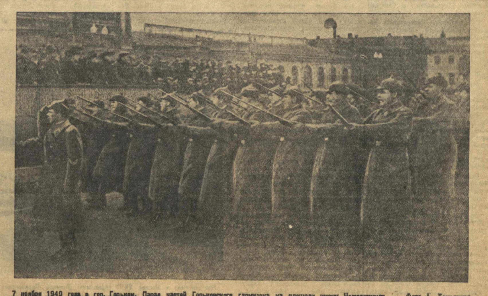
7 ноября 1940 года в гор. Горьком. Парад частей Горьковского гарнизона на площади имени Челюскинцев.

В демонстрации трудящихся города Ленина участвовало 1.300 тысяч человек.