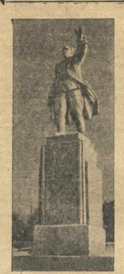
Скульптура В. В. Нуйбышева, установленная в сквере у начала Комсомольского с/езда (Нуйбышевский район, г. Горький).