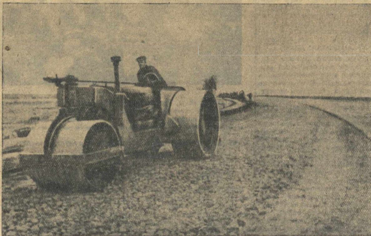
На строительстве дороги Горький—Муром—Кулебаки. Укатна замощенного участка (Вачский район).