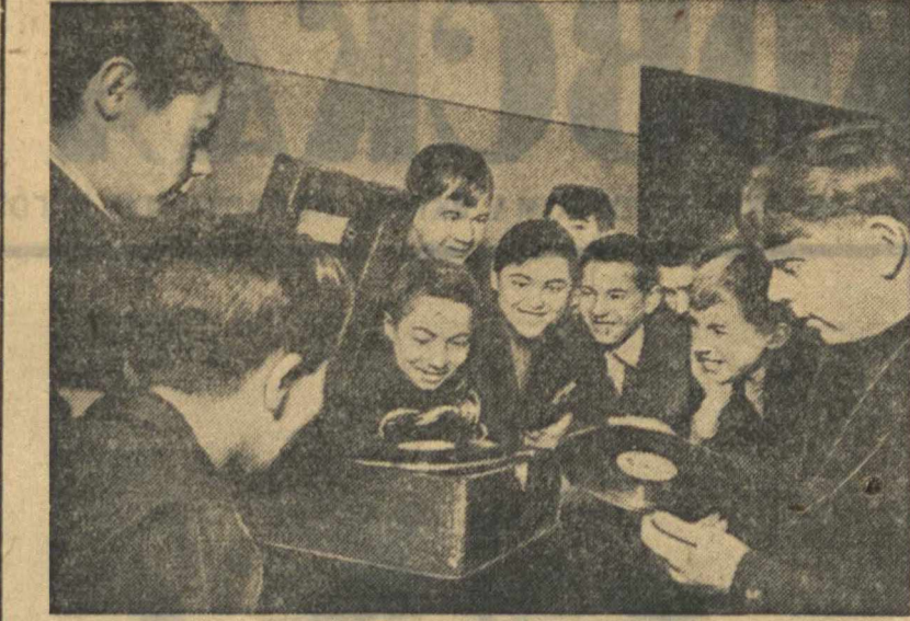
В ленинской (г. Горький) районной комиссии по призыву в ремесленные училища. На снимке: в комнате отдыха призванные слушают патефон.

Однако, многие райисполкомы проводят сессии райсоветов нерегулярно. Починковский и Воротынский райисполкомы за 9 месяцев провели только по 3 сессии. В Б. Мурашкинском, Шатковском, Борском, Яловском, Ветлужском районных сессиях райсоветов созываются через 3—5 месяцев. Характерно, что там, где сами райисполкомы нарушают Конституцию, их «спирит» следуют и сельсоветы. Исполком Шатковского сельсовета, Шатковского района, не созвал сессии в январе, феврале, марте, мае, июле и августе. В Керженецком сельсовете того же района сессия не созывалась с 2 февраля по 16 июня. В Яловском сельсовете, Б. Мурашкинского района, за 9 месяцев проведено всего 3 сессии. Можно назвать сельсоветы Сергачского района — Акузовский, Ачкиский, Лопатинский, Сосновский; Фоминского района — Гришинский и Волчихинский; Ветлужского района — Сергачинский, Микряхинский и Пронский, в которых не созывались ст. 86 Конституции РСФСР о созыве сессий сельсоветов не реже одного раза в месяц.