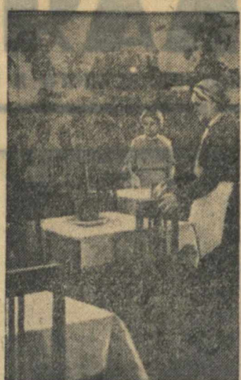
Комбинат общественного питания при заводе «Красное Сормово» открывает столовую для учащихся ремесленного училища. На снимке: внутренний вид столовой.