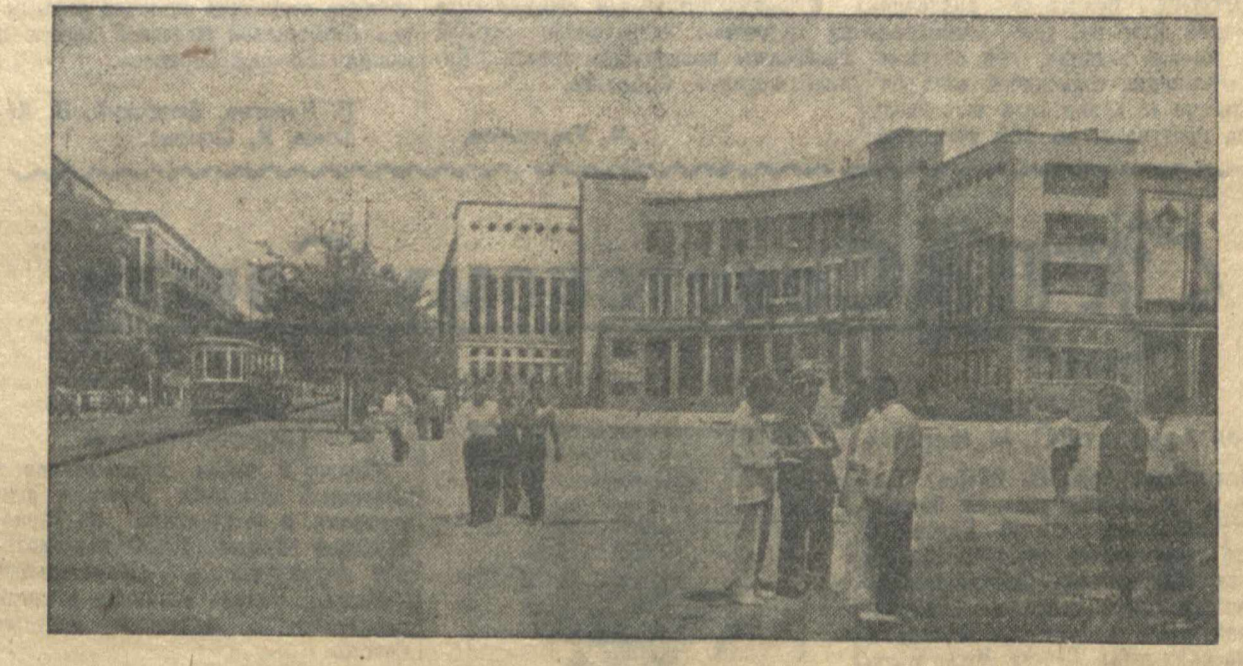
Здание нового кинотеатра «Москва» в Ереване.