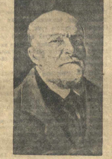
Н. И. Пирогов.

Блестящая защита диссертации Пироговым (перевязка брюшной артерии) привлекла внимание всего факультета. Диссертация была переведе-