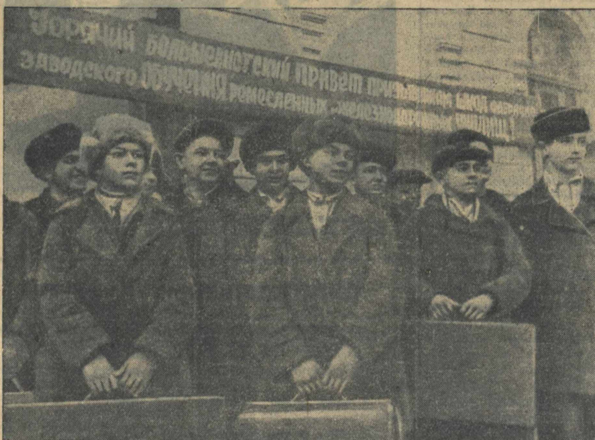
В Горький из районов области прибывают призванные для учебы в ремесленных училищах и школах ФЗО. На снимке: группа призванных из Первомайского района; они будут учиться в ремесленном училище Станкозавода. (Снимок сделан на Казанском вокзале).

На 25 ноября колхозы Горьковской области выполнили установленный на 1940 год план заготовок льноволокна на 100,8 проц., льносемян — на 100 проц.