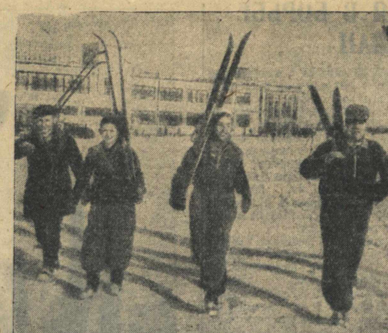
Зимний спортивный сезон начался. Лыжники ДСО «Торпедо» (автотавол им. Молотова) 1 декабря вышли на первую тренировку.

Япония и «правительство» Ван Цзин-вее, говорится далее в соглашении, осуществят особое тесное сотрудничество в развитии торговли в нижнем бассейне реки Янцзы и в удовлетворении потребности в снабжении товарами между Японией, с одной стороны, и Северным Китаем и Внутренней Монголией, — с другой.