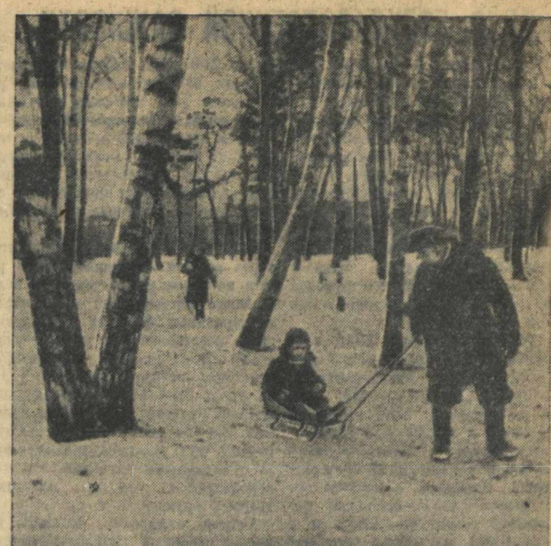
В саду им. 1 мая (г. Горький).