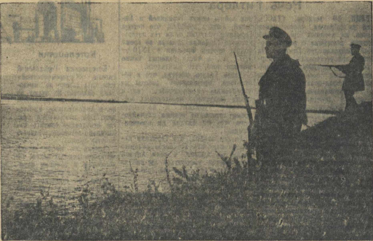
Советская граница на Дунае. На снимке: пограничный наряд охраняет границу.