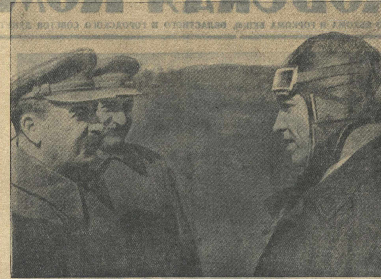
Товарищи Сталин и Орджоникидзе беседуют с Чкаловым на аэродроме в Москве 2 мая 1935 г.

Но у нас были и другие трудности. Когда произошло фарфоровое облечение, паростовная трубка из радиатора замерзла. В радиаторе