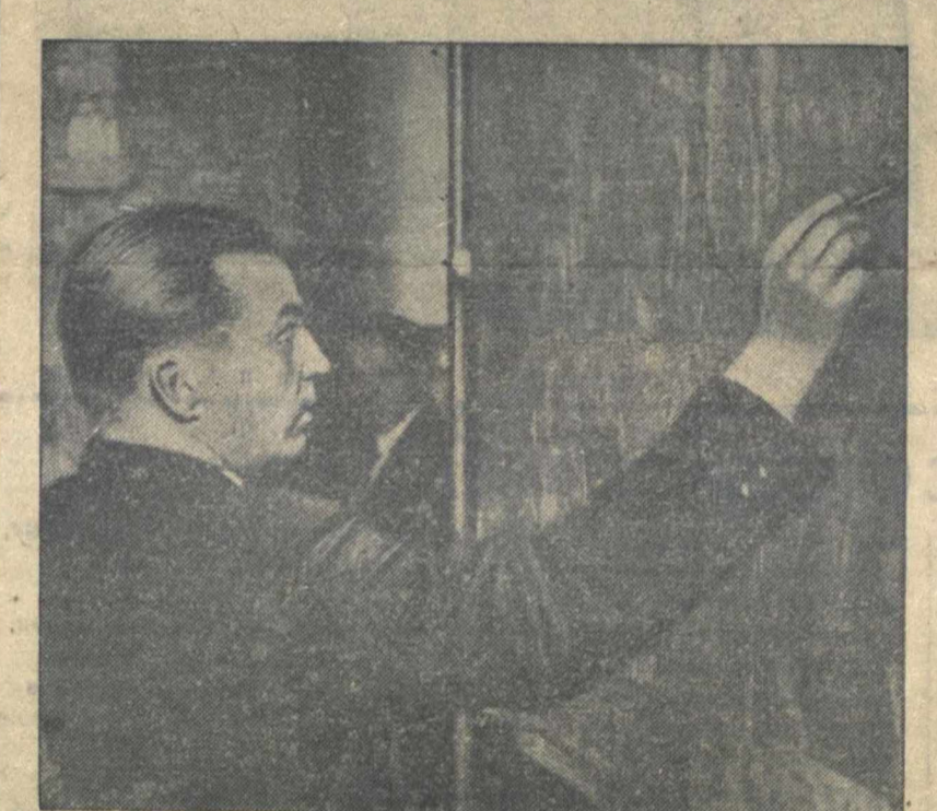
В. П. Чкалов в редакции газеты «Горьковская коммуна» (август 1936 г.).

— Устройте, чтобы я утром вашу газету получал. Иногда ночью он заходил в редакцию, смотрел свежие оттиски газетных страниц.