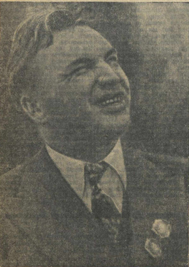
В. П. Чкалов наблюдает за полетом самолета (август 1937 г.).

Но я всегда говорил и говорю всем, что экипаж принесит первую и глубочайшую благодарность коммунистической партии, товарищу Сталину, воспитавших нас таким. (Бурные продолжительные аплодисменты, все делегаты встанут и устроятся овацию тов. Чкалову. Возгласы: Тов. Чкалову — ура! Сталинскому сыночку, тов. Чкалову — ура! Да здравствует великий Сталин!).