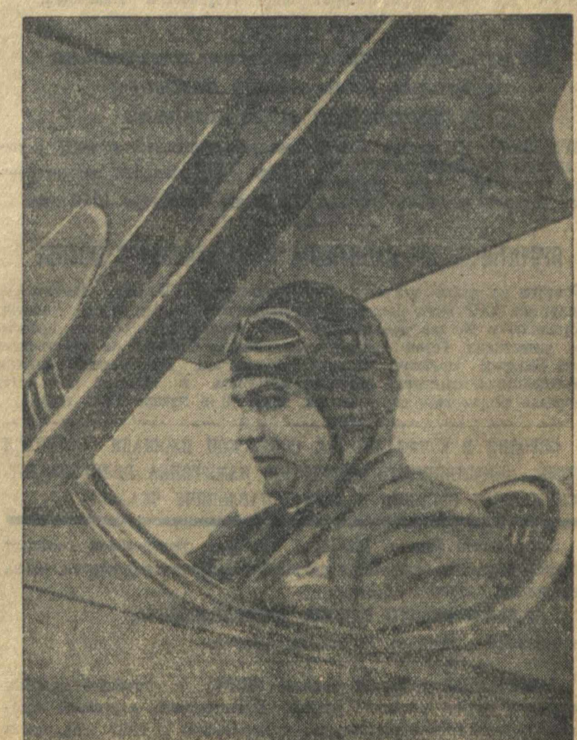
В. П. Чкалов в кабине самолета (июнь 1938 г.).