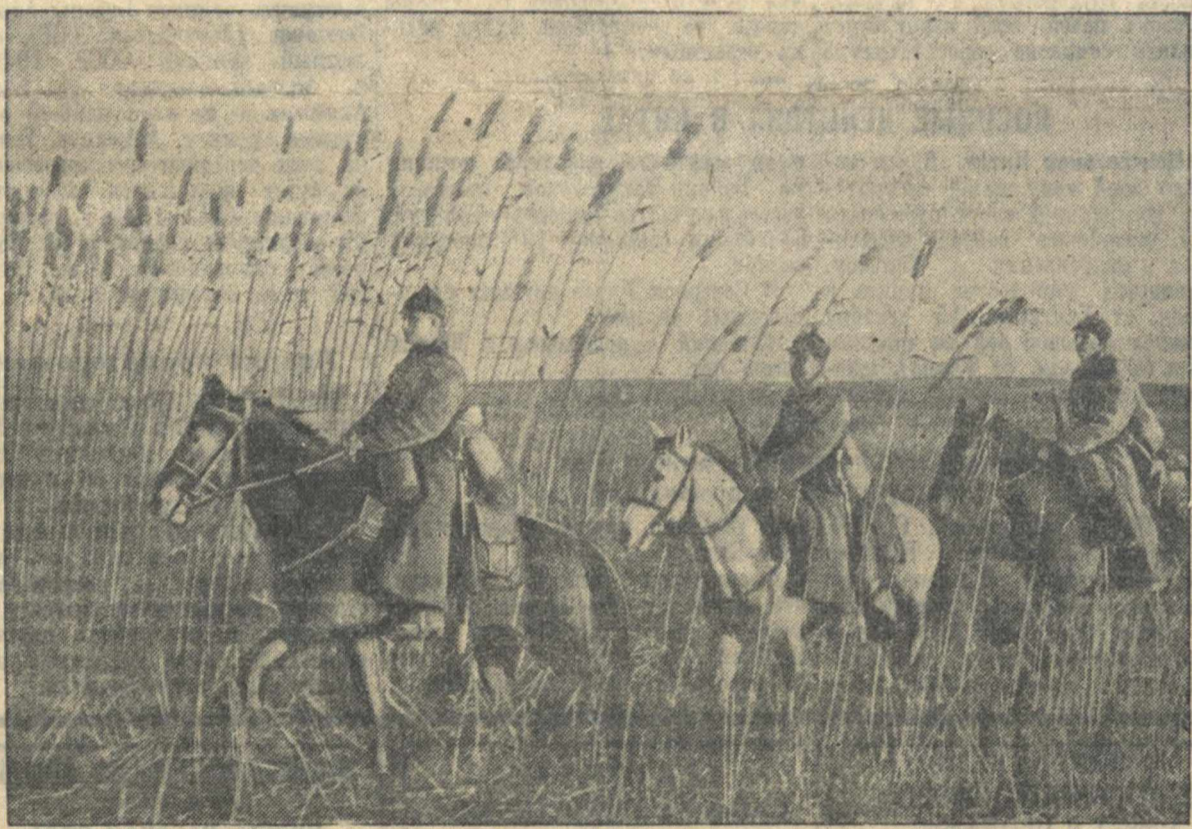
Номный наряд (Средне-Азиатская граница СССР).

На письмо о пьянстве счетовода Братского колхоза Пыгалова