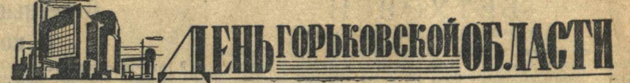
Заводу «Красная Этна» 25 лет