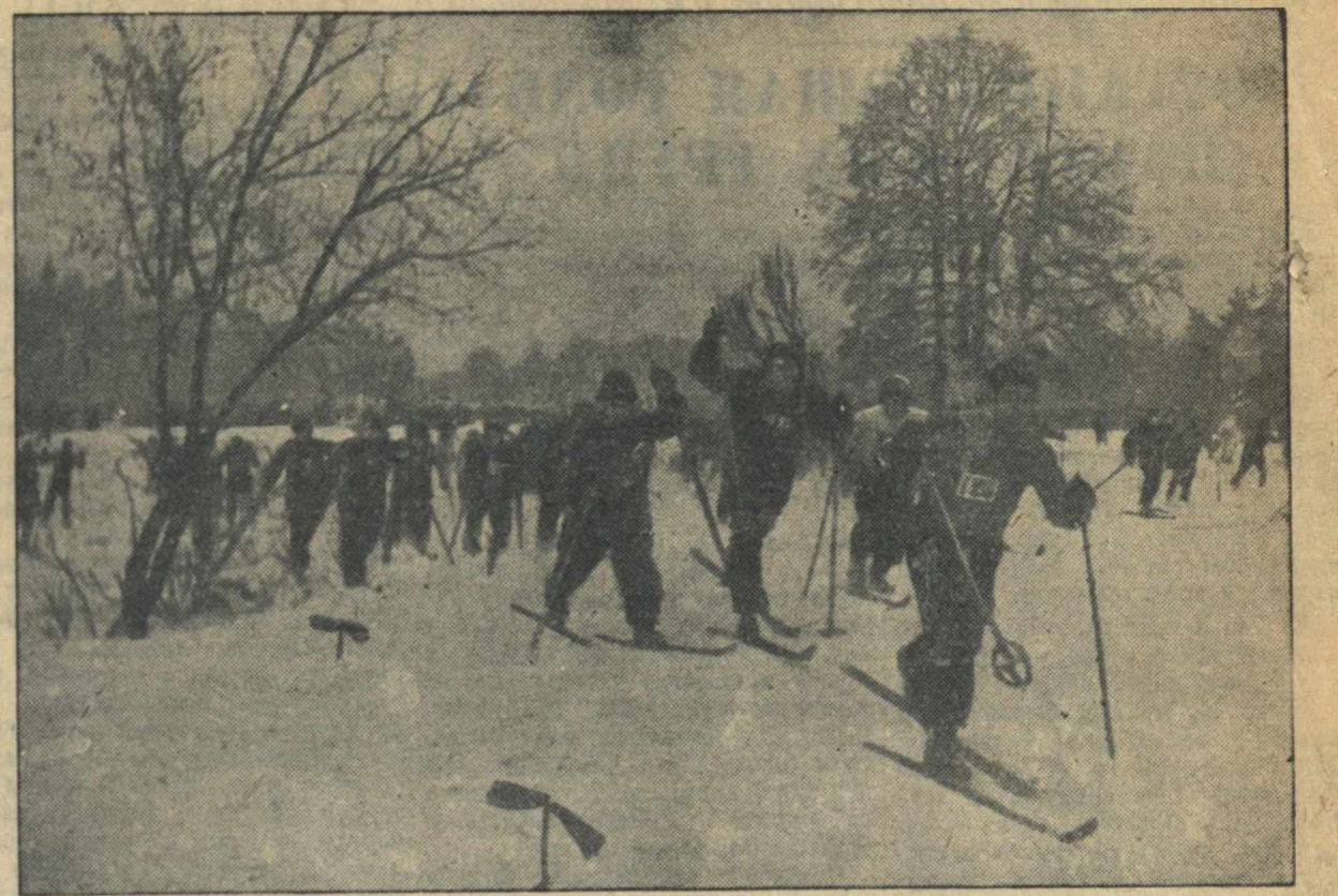
22 декабря на Шаповаловском хуторе проводилась традиционная лыжная эстафета имени В. П. Чкалова. На снимке: старт мужских команд в эстафете 5x5.

Снаряды, которые уже изготовлены, настолько чувствительны, что взрываются при соприкосновении с бумагой. Однако такие снаряды опасны для транспортировки. Производятся также опыты по усовершенствованию 75-миллиметровых пушек. Уже производились стрельбы из таких пушек, установленных на тяжелом бомбардировщике. Как сообщает корреспондент, на новейших английских и американских тяжелых бомбардировщиках в хвостовой части установлены 37-миллиметровые пушки.