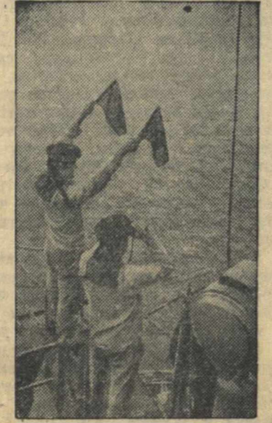
На сигнальном мостике Н-сигого корабля (Черноморский флот).

Опровержение ТАСС Шанхайский корреспондент «Нью-Йорк таймс» утверждает, что китайская армия получает через Владивосток большое количество военных материалов, медикаментов и другого снабжения и что американский военный офицер Карлос в ближайшее время направится во Владивосток, чтобы ускорить отправку военных материалов в Китай. ТАСС уполномочен опровергнуть это сообщение, как вымышленное от начала до конца. ХРОНИКА Совнарком СССР назначил академика Патона Е. О. членом совета по машиностроению при Совнаркоме СССР. (ТАСС). Совнарком СССР освободил т. Ми-