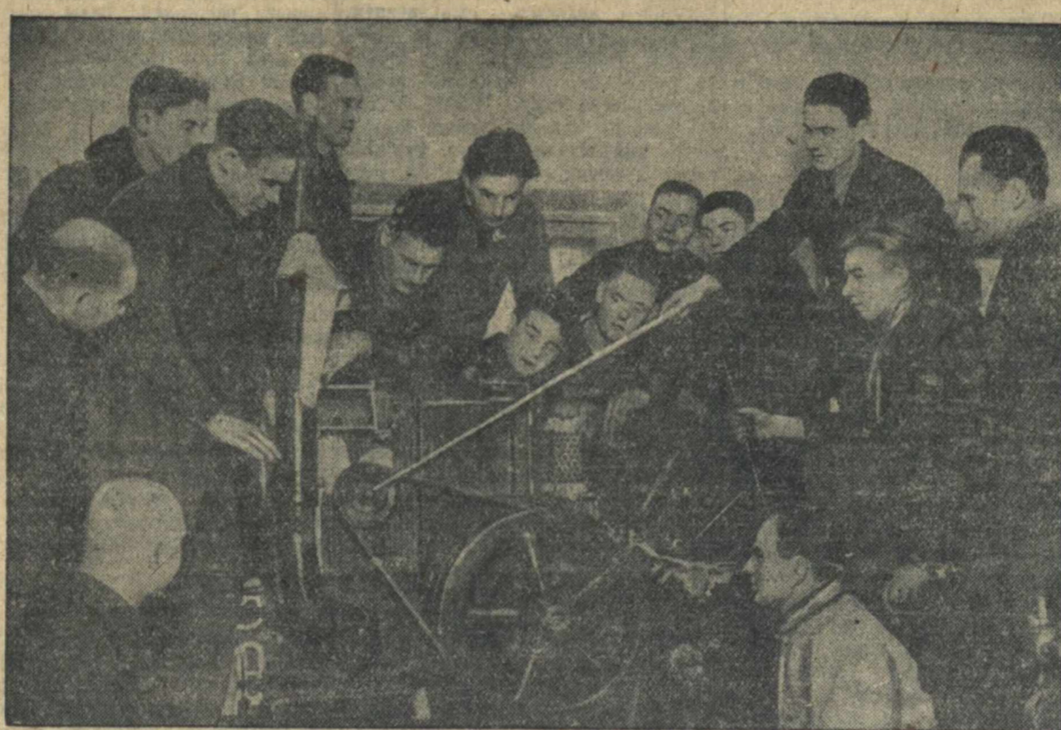
Подготовка трактористов в Эстонской ССР. На снимке: крестьянская молодежь Тартуского уезда занимается на курсах трактористов.

Городской район годовой финансовый план на 17 декабря выполнил на 109 процентов.