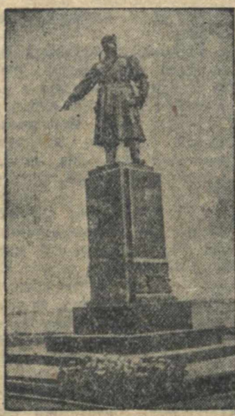
По городам Советского Союза. На снимке: памятник Герою Советского Союза Виктору Степановичу Хользунову в г. Сталинграде.

В числе других материалов сохранилась переписка московской охранки, начальника Таврического губернского жандармского управления, дошедших о поездках Алексея Максимовича Горького из Риги в Москву и Ялту. (ТАСС.)