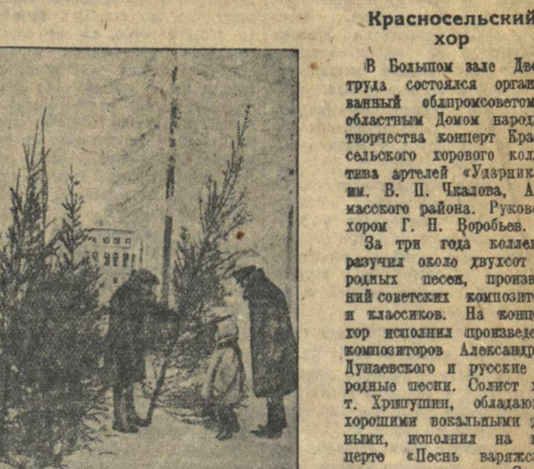
Продажа елок в Детском саду (г. Горький).