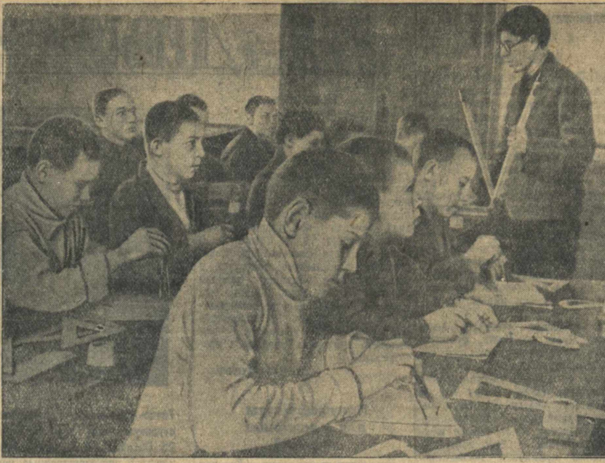
Ремесленное училище № 5 Ворошиловского района. На уроке черчения в группе № 16 слесари-инструментальщики.

Ученики, проживающие в городе, в заводском поезде несут ответственность за организацию систематической работы в виде беседы о международной обстановке, художественной литературе и т. д. и т. д.