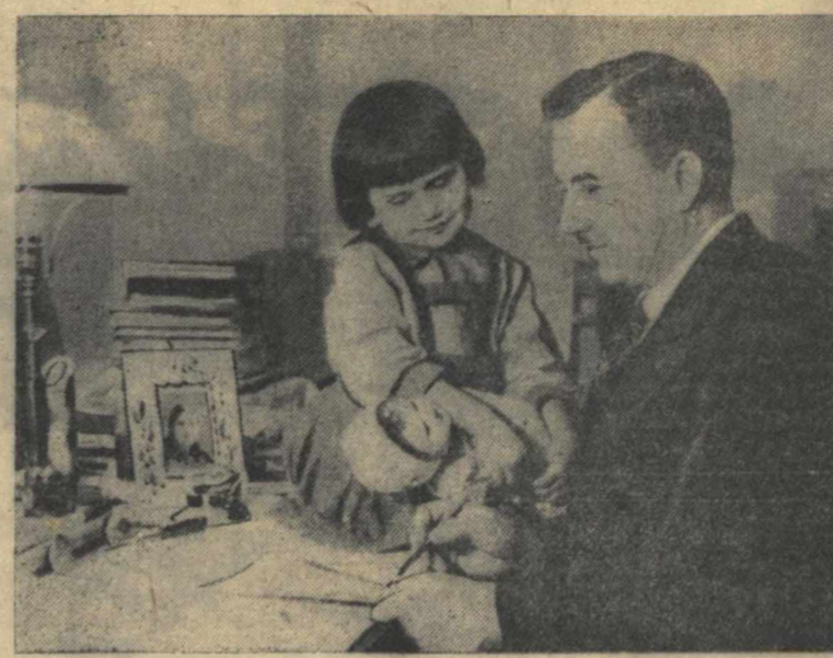
Текст Л. Хайкиной.

На письменном столе профессора два портрета. Временами, отрываясь от книги, Константин Гаврилович видит перед собой гениальное лицо вождя и улыбающегося круглого личико дочки. Своей шестилетней Леночке отец может посвятить только пять минут.