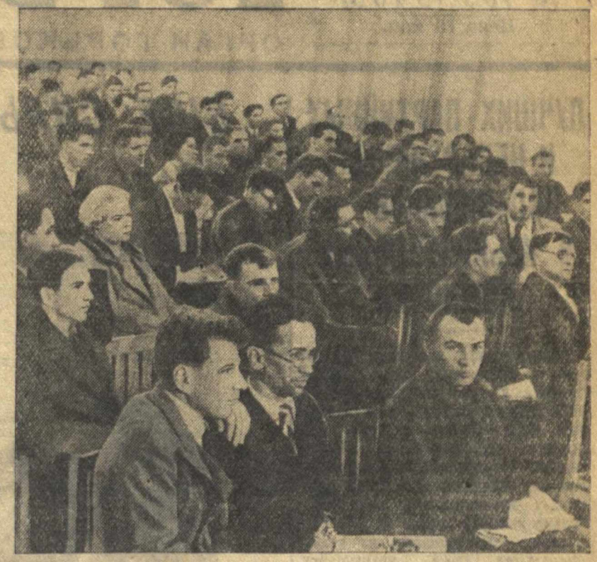
На собрании партийного, профсоюзного и комсомольского актива в г. Горьком 5 мая, посвященном Дню печати.

Факты разоблачения врагов народа в городской организации особенно обязывают газеты «Горьковская коммуна» и «Горьковский рабочий» еще острее ставить вопросы политической бдительности, активно и постоянно помогать парторганизации в беспощадном разоблачении и выкорчевывании врагов партии и народа. Для этого газеты обязаны, прежде всего, решительно очистить свои аппараты от всех чуждых и политических сомнительных элементов, проверить внепартийные авторские кадры, выдвигать на работу новых проверенных людей из числа рабкоров и селькоров, держать свои коллек-