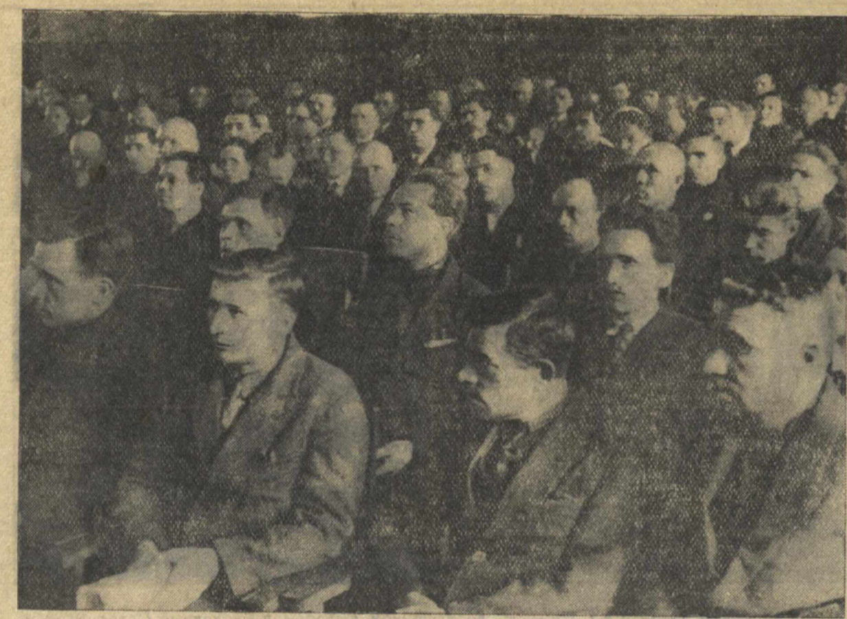
На третьей партийной конференции Ленинского района г. Горького.