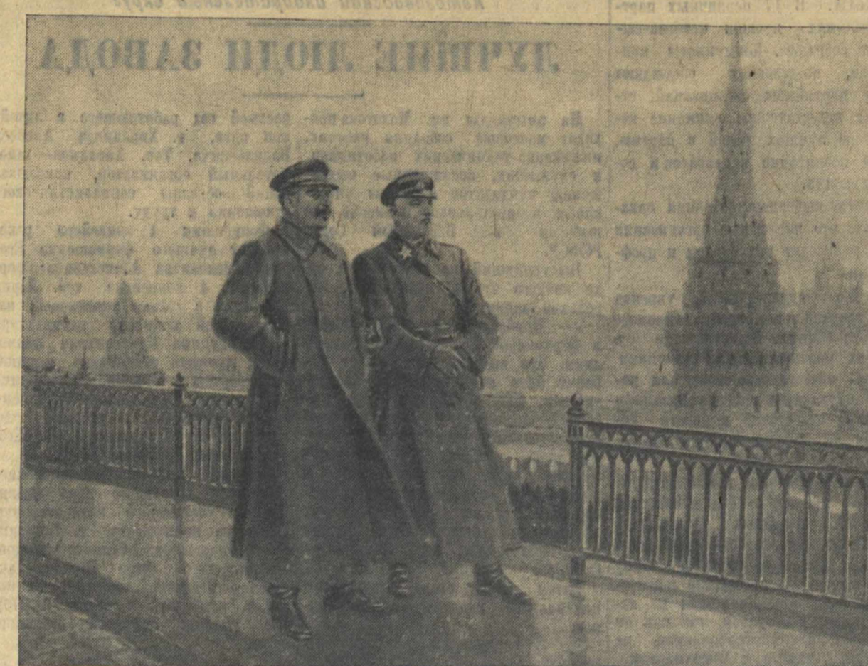
5 мая в Москве открылась художественная выставка «20 лет РККА и Военно-Морского Флота». На выставке представлено около 450 произведений живописи, скульптуры и графики виднейших мастеров советского искусства. На снимке: «И. В. Сталин и М. Е. Ворошилов». Картина заслуженного деятеля искусств орденосца А. М. Герасимова (Выставка «XX лет РККА и Военно-Морского Флота»).

СТАЛИНАБАД, 9 мая. Президиум Центрального Исполнительного Комитета Таджикской ССР постановил предоставлять право голосования при выборах в Верховный Совет Таджикской ССР избирателям, получившим «удостоверение на право голосования» на выборах в Верховные Советы других союзных и автономных республик в случае переезда их на территорию Таджикской ССР, при предоставлении удостоверения личности и «удостоверения на право голосования».