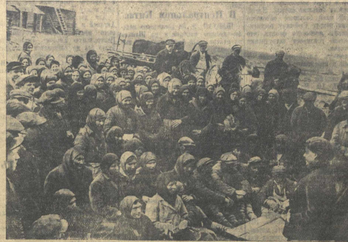
9 мая в обеденный перерыв в Гопелевском колхозе «Ильич», Д-Константиновского района, состоялось общее собрание колхозников, посвященное выдвижению кандидатур в состав участковой избирательной комиссии.

Ввиду того, что в большинстве колхозов отсутствуют ревизионные комиссии, ревизионная работа в МТС инструкторы — бухгалтеры не обеспечены средствами передвижения. Если к этому добавить отсутствие должной заботы об их материально-бытовых нуждах, станет понятной причина огромной текучести инструкторов — бухгалтеров (только в 1937 г. ушло с работы 60