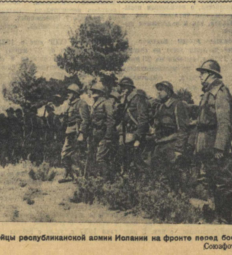
Бойцы республиканской армии Испании на фронте перед боем.

ЖЕНЕВА, 10. Вчера сюда прибыл министр иностранных дел Испанской республики Альварес Дель Вайо. Он заявил представителям печати: «Привык в Женеве записывать дело испанского народа перед судом мирового общественного мнения, а хочу заявить, что не может быть и речи о каких-либо переговорах, могущих привести к перемирию. Испанская