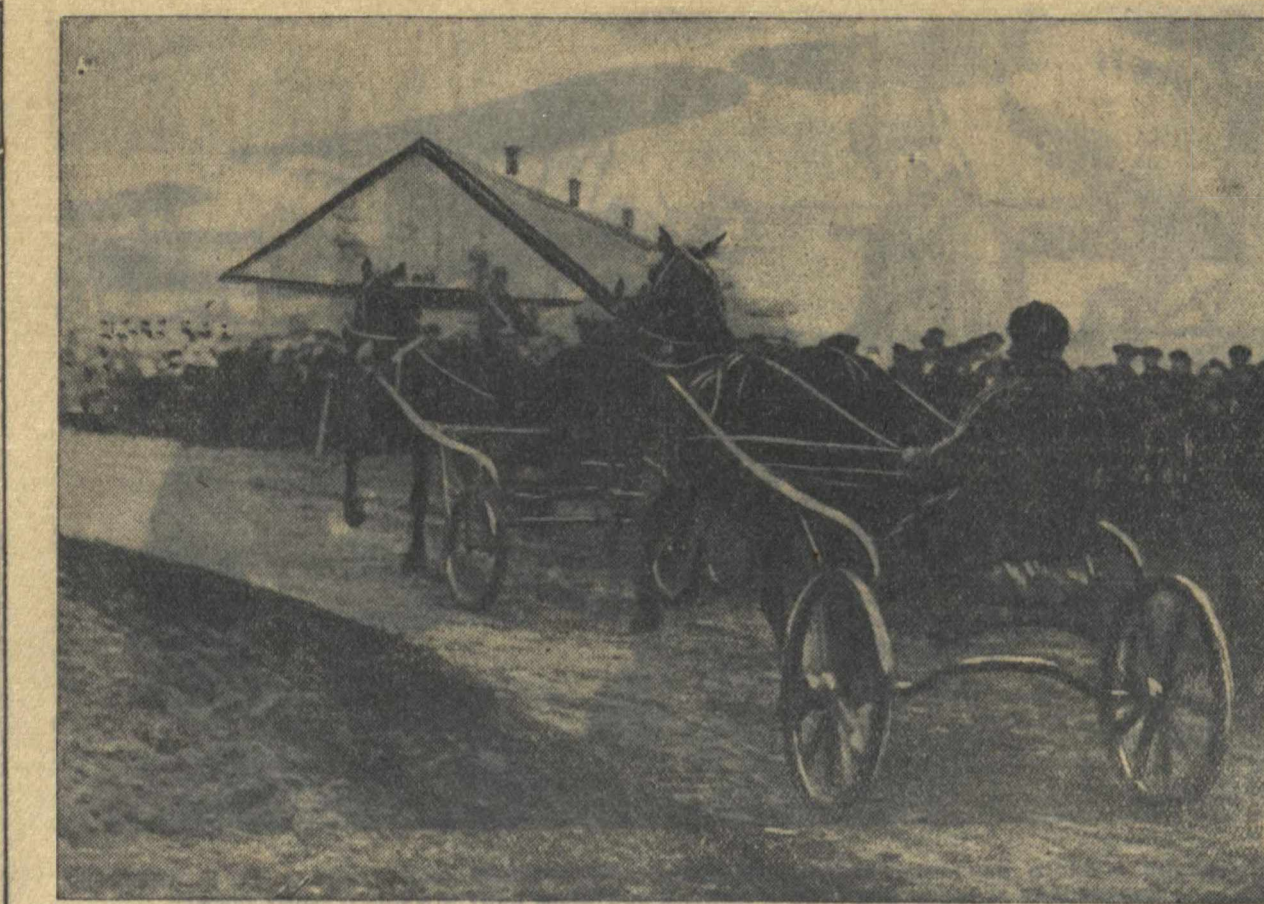
Первые испытания рысистых лошадей колхозов Д. Константиновского района на беговой дорожке конюшарной фермы колхоза «Красный партизан»

Широко применявшаяся до революции ученичество служило самой жесткой формой эксплуатации труда подростков. Нормальный рабочий день на крупных фабриках и заводах составлял в среднем даже для молодежи 10 часов, в мелких предприятиях продолжительность рабочего дня была еще больше. Работать приходилось в антисанитарных условиях. Игнорировались самые элементарные требования охраны труда. Отсюда частые увечья, отравления, несчастные случаи, оканчивавшиеся нередко смертностью. По данным фабричной инспекции довоенного времени, на каждые 1000 рабочих в год приходилось 32,5 несчастных случая. И больше трети пострадавших от несчастных случаев составляла рабочая молодежь. Молодежь не пользовалась отпусками: о домах отдыха, санаториях, курортах рабочая молодежь не слыхала и мечтала. Фабричный инспектор Гвоздев, посетив Лудевскую фабрику, так записал свои тогдашние впечатления: «Здесь я встречал малолетних, вид которых производил ужасное впечатление: таких истомленных лиц, глаза, как глубоко впадины, в глазах, совершенно синими поглазницами вы выйдете на встречу».