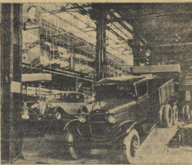
Главный конвейер автозавода им. Молотова.