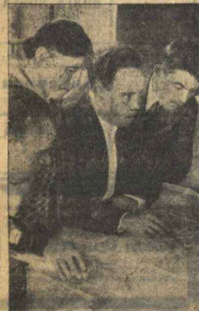
Первое заседание Д. Константиновской окружной избирательной комиссии по выборам в Верховный Совет РСФСР.