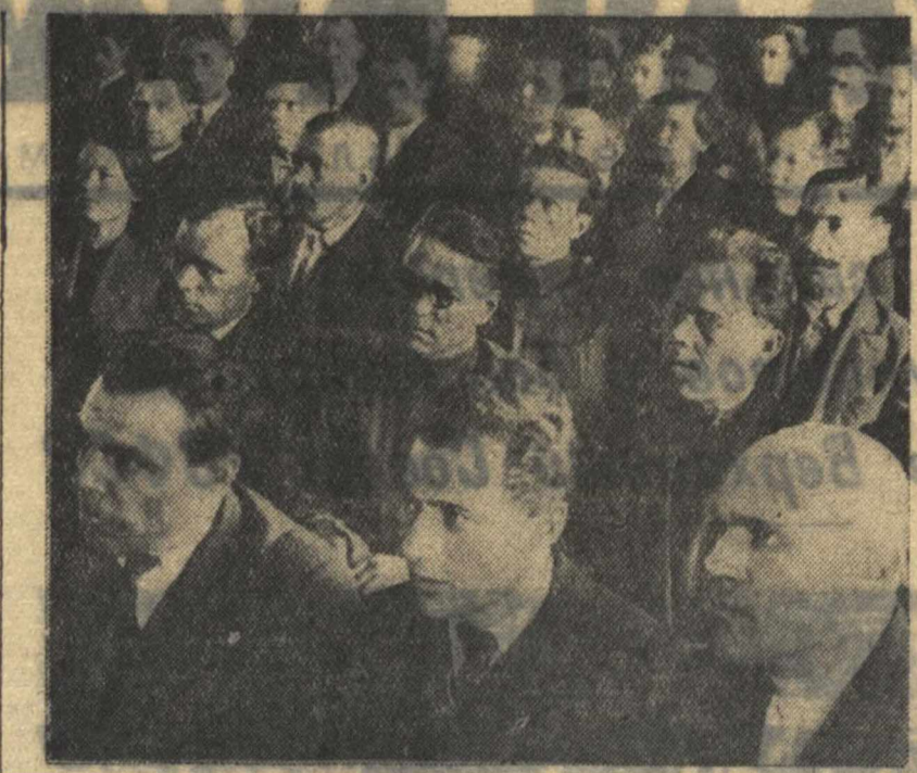
На партийной конференции Ждановского района гор. Горького.