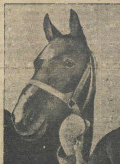
Монх нолдза «Красный партизан»...