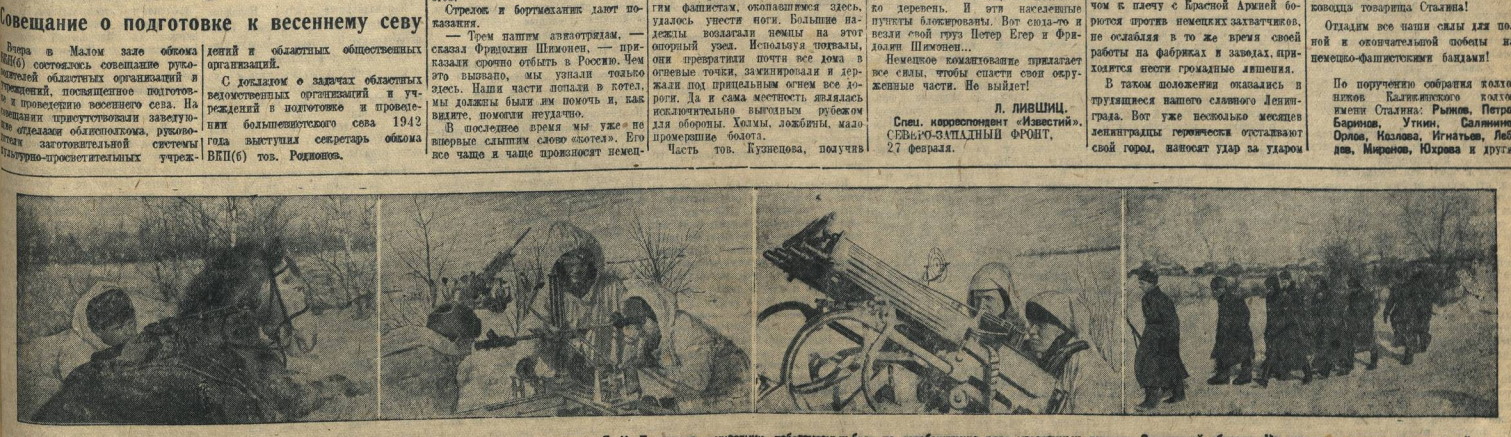
На фронтах Отечественной войны. 1. Старшина, который командует напавшим отрядом... наши войска прорвали все... активные боевые действия... против немецко-фашистских войск.