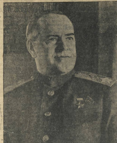
Маршал Советского Союза Г. К. Жуков, награжденный Указом Президиума Верховного Совета Союза ССР орденом «Победа».

Работа о подготовке тягла — это работа о весеннем севе, о высоком урожае. Чем лучше будет подготовлено тягло, чем упитаннее и работоспособнее коня, чем больше будет приучено к работам коров и быдолов, тем успешнее наша область справится не только с весенним севом, но и со всеми сельскохозяйственными работами.