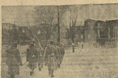
Третий Белорусский фронт. Восточная Пруссия. В городе Интербург, занятый советскими войсками.