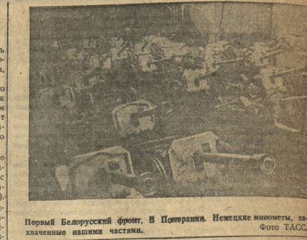
Первый Белорусский фронт. В Померании. Немские миноры, захваченные нашими частями.

В преддверии дня рождения великого полководца С. Суворова альпинистские скалы со скульптурой и барельефом скульптора Колобова.