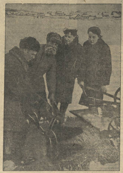
Взаимопроверка колхозов по подготовке к весеннему севу.

Предложения проверочных комиссий проводятся в жизнь... В каждом колхозе необходимо иметь в полной готовности семена, тягло, машины и инвентарь... Проверочные комиссии должны следить за этим.