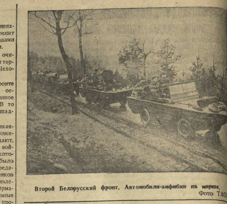
Второй Белорусский фронт. Автомобиль-амфибия на марше.