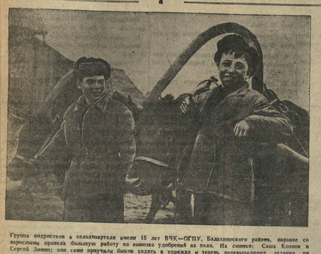
Группа подростков в сельхозартели имени 15 лет ВЧК-ОГПУ, Балашихинского района, накануне сарсенского праздника... Группа подростков в сельхозартели имени 15 лет ВЧК-ОГПУ, Балашихинского района, накануне сарсенского праздника...