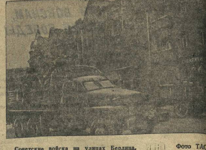
Советские войска на улицах Берлина.