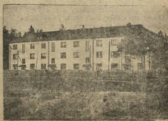
На окладе: Оди из заводской школы на улице «Красная Борна» в городе металлургическом завод.