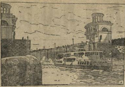
Канал Москва—Волга. Пассажирский катер «Камантин» выходит из шлюза № 5.

Нам опять руководителем старомартеновского цеха, что отменяет систему руководства не укрепляет, а ослабляет нашу дисциплину. МАРТЕНОВЕЦ