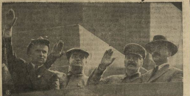
На трибуне Мавзолея (слева направо) товарищи Хрущев, Димитров, Сталин, Молотов.

12 сентября в Москве на Красной площади состоялась мощная демонстрация, посвященная празднованию XXIII Международного Юношеского Дня.