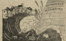
Финишский сворз у ворот Мадрида.