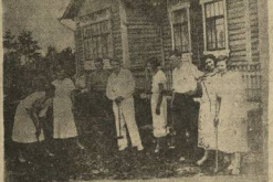
Рабочие нашего завода в зоне отдыха за игрой в крокет

С лесной о родине нашей чигурия, С лесной к труду и победам зудушей, Забойте согрел и милостив сердеч Сталин—мудрейший, любимый отцы