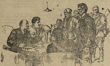
В. И. Ленин и И. В. Сталин в Смольном.