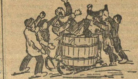
Приподняли ноги и бултыхнули в бочку.

Он вышел на крыльцо бедный, а сзади тянулись руны жены. Она пугалась его и билась, и дергалась в кусты, как дым в их фабричной печи и с ошощенным от ужаса ртом умоляла не ходить.