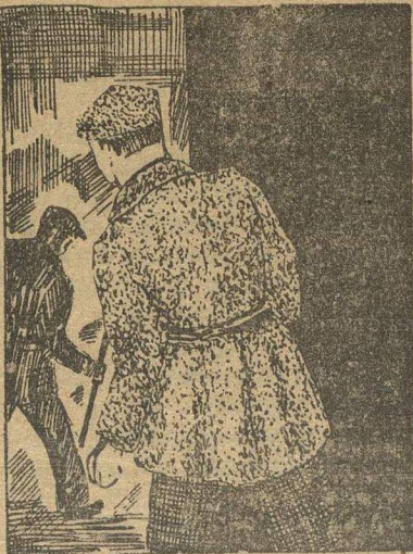
Ждал только момента.

Второй пулей вдребезги разбита предательская воля меньшевика. Сломлена решимость.