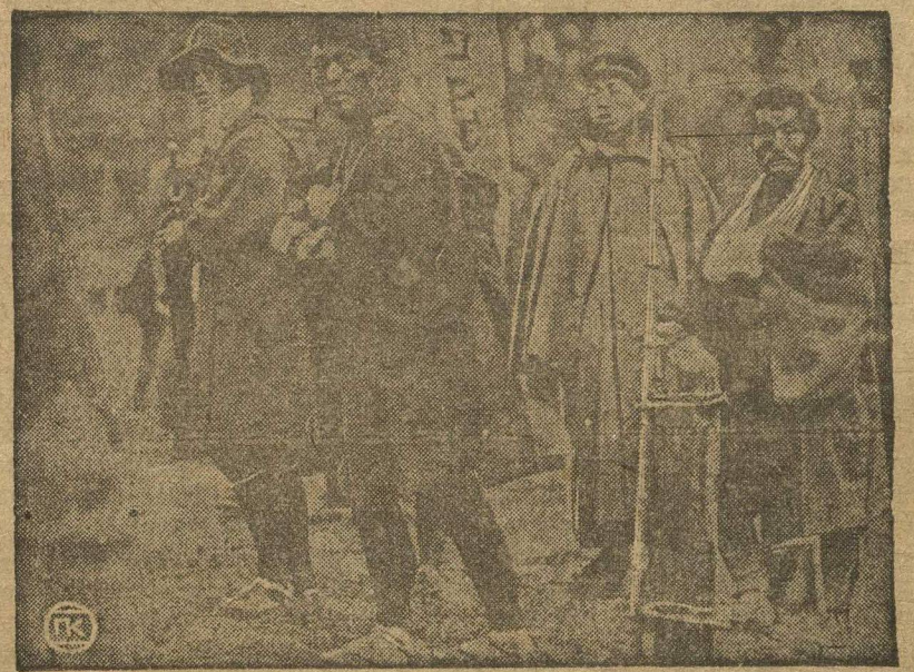
Кантонская армия ведет успешные бои в провинции Чжа-Цзян, на южных подступах к Шанхаю. На снимке—солдаты реакционной армии (маршала Сун-Чуан-Фана), взятые в плен кантонцами.