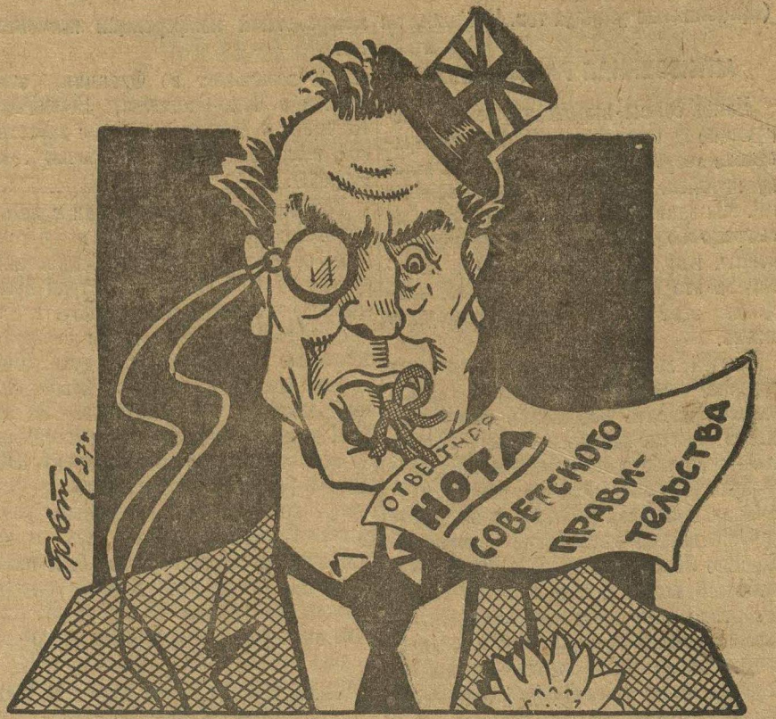
«Типун» на языке мистера Чемберлена.

Чемберлен заявил в палате общин, что английское правительство не намерено посылать какого-либо ответа на ноту советского правительства. (Из газет).