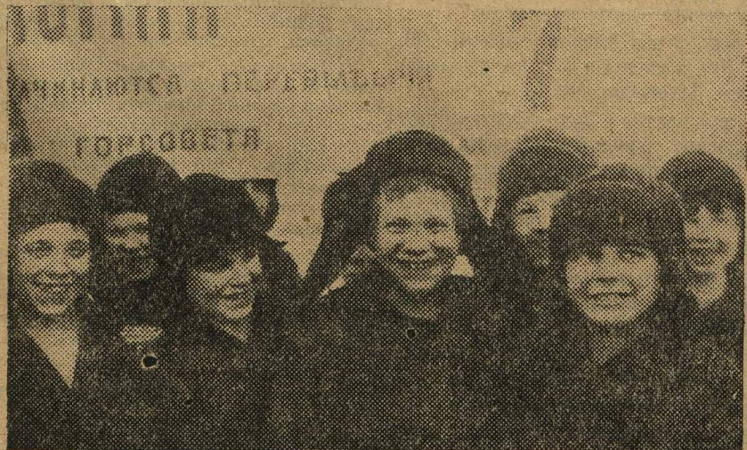
Воспитанники детдомов на предвыборной демонстрации в городе.