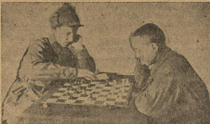
Партия между пионером и красноармейцем.

Через час Колонный зал полон молодежи. Собрались человек двести. Из них участников турнира 117 чел.