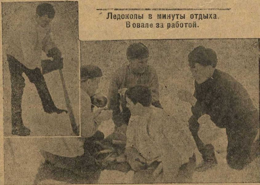
Ледоколы в минуты отдыха. Вовале за работой.

работают. Эх, как тяжело было с непривычки-то. Все руки, бивало, отвертятся на работе. А теперь свыкся. Только студимся мы здесь. Раздетым,