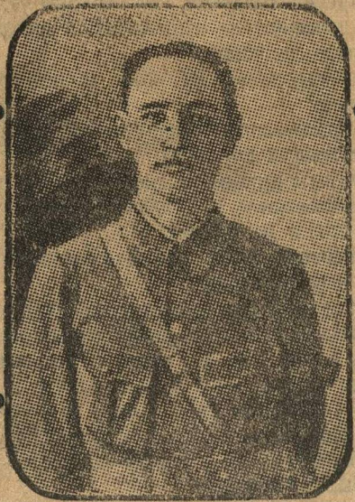
Чан-Кай-Ши—главнокомандующий национально-революционной армии.

ШАНХАЙ, 22. Первая дивизия первого национально-революционного армейского корпуса вступила сегодня утром в Шанхай. Вся китайская часть города, за исключением района северной станции, продолжает оставаться сегодня в руках рабочих, которые в результате разоружения полиции и оккупации арсенала прекрасно вооружены. Весь южный район напоминает первые дни Октябрьской революции. Вооруженные рабочие имеют вид типичных красногвардейцев, несущих службу. Это впечатление особенно усиливается в трамвайном парке, который является по существу главным штабом восставших: рабочие вооружены там не только ружьями, но и пулеметами, ручными гранатами и другим оружием. В южной части города происходят митинги и демонстрации; трибуны воздвигнуты повсюду. На созванном сегодня центральном митинге присутствовало более 30 тыс. человек. Основное содержание речей состояло в призыве к поддержке восстания, как являющегося частью народно-революционного движения. Далее ораторы призывали к поддержке народно-демократического правительства Шанхая, призывали приветствовать национально-революционные армии и национальное правительство. Сегодня утром на заседании исполкома конференции народных делегатов было избрано временное правительство Шанхая, на основе комитетской системы, принятой в национальном правительстве. Правительство состоит из 12 человек, в том числе из нескольких коммунистов, из которых один представляет непосредственно шанхайскую организацию компартии и нескольких рабочих.