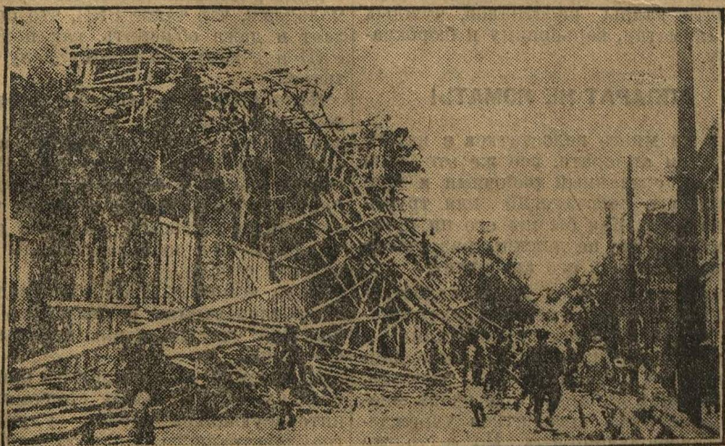
Как известно, во время последнего землетрясения в Японии было убито обвалом 9.000 человек и 70.000 осталось без крова. На нашем снимке разрушенные дома в Осаке.