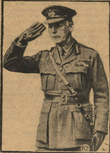
ТЕ, КТО РАССТРЕЛЯЛИ НАНКИН.

Английская рабочая газета «Дейли Геральд» заявляет, что в виду отказа Японии и Соединенных Штатов предъявить совместно с Англией ультиматум национальному правительству, мало вероятно, чтобы Англия одна приступила к блокаде Китая. «Но», — продолжает газета, — в официальных кругах обсуждаются и другие планы, в том числе и план оказания военной помощи Чжан-Цзо-Лину, под предлогом охраны иностранных концессий в Пекине и Тяньцзине.