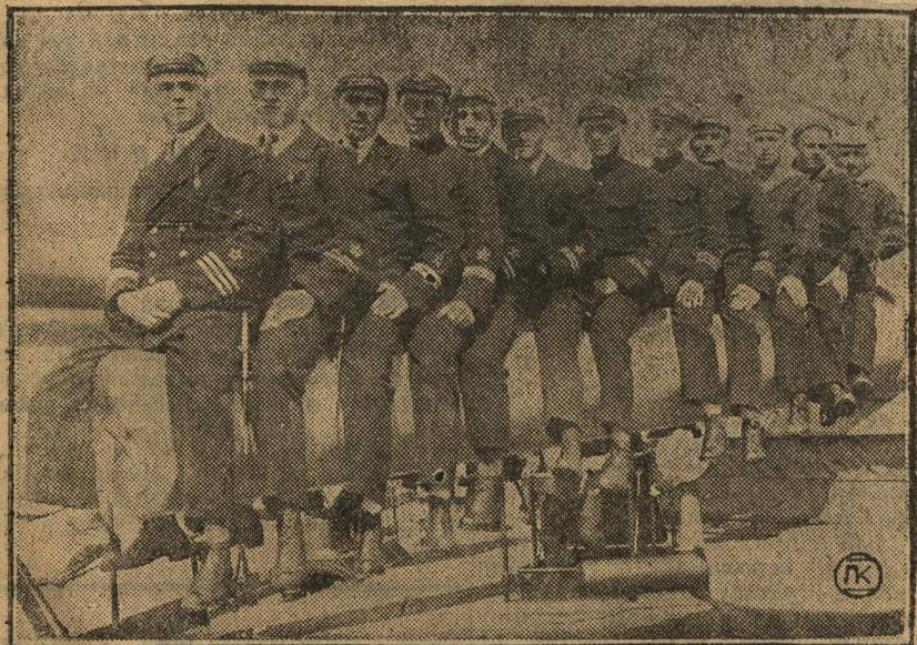
Краснофлотцы с линкора «Марат» на эрудии.