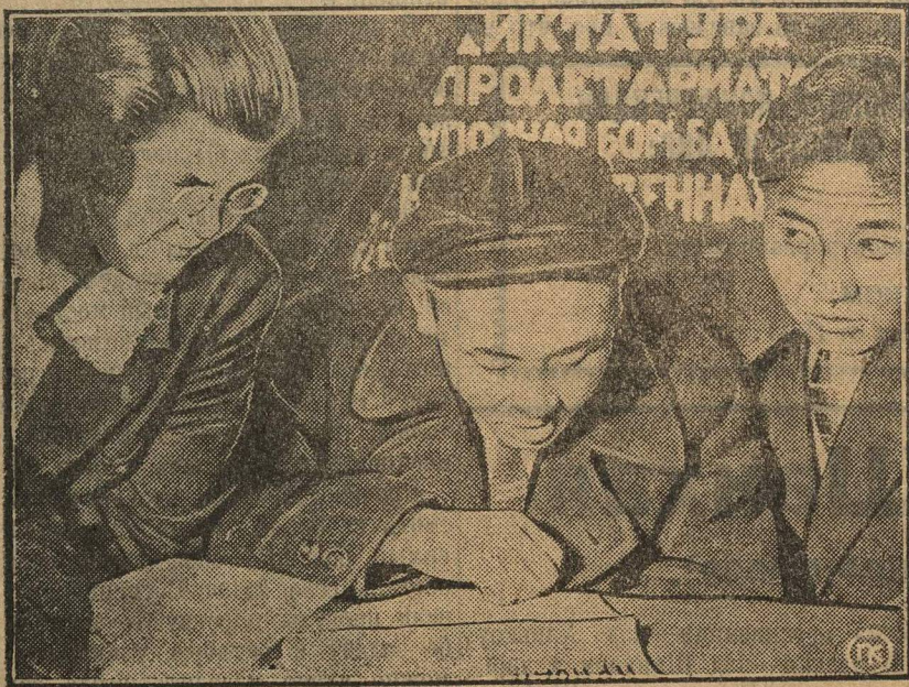
Студенты коммунистического университета трудящихся Востока, в клубе за чтением газет и журналов.