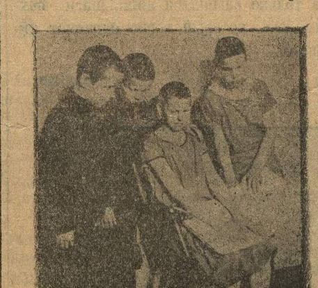
За чтением книги.

испорченности в их поступках или в их взаимоотношениях. «Эх, кабы мне глаза—полезен бы был я для революции!