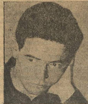
Шальман взявший 2 приз.

Для розыгрыша призов они сыграли дополнительную партию, выигравшую Александровым.