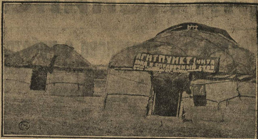
Юрта-читальня и агитпункт у кочевых киргиз в Актюбинской губернии.

Всем деревенским ячейкам, всем организациям Союза надлежит внимательно изучить опыт Белоруссии, историю развития этих школ, чтобы применить у себя. Дело не сложное, была бы охота.