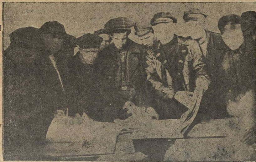
НА ВЫСТАВКЕ «МОЛОДОЙ РАТИ». РАССМАТРИВАЮТ ГАЗЕТУ.

ОКОНЧАНИЕ ДОКЛАДА Т. САЛТАНОВА СОДОКЛАД Т. ЛЯПУНОВА И ПРЕДНИЯ БУДУТ ПОМЕЩЕНЫ В СЛЕД. № «М. Р.».