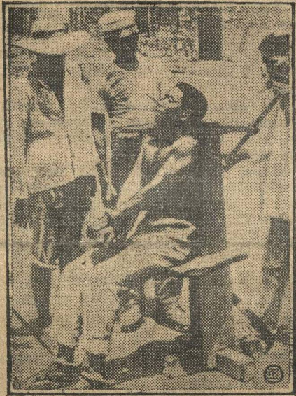
Казнь через медленное удушение.

По этому способу были удушены двадцать китайских коммунистов мунденскими палачами в Пекине.